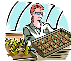
Viveros, plantando plantas, trabajando con la tierra Tree Planting, or cutting. Greenhouse, Nursery, Sod