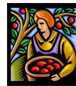
Verduras o camote Harvest of fruit and vegetables or sweet potatoes