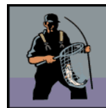
La Pesca, Procesando Pescado Fishing, Processing Fish