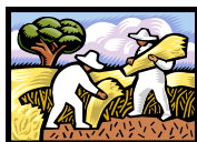
Cultivando, Preparando la tierra Cultivation, Preparation of Soil