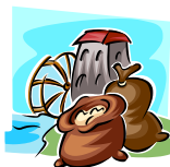
Moliendo Algodón Milling, Cotton Gin work