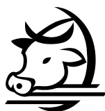
Con el ganado, Procesando, Empacando Feed Cattle, Processing

Encierre en un círculo los trabajos que haya hecho usted o alguien de su familia, (Please circle the jobs a family member or you have done):