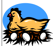
En la Pollera, Procesando, Empacando Poultry Processing, Packing